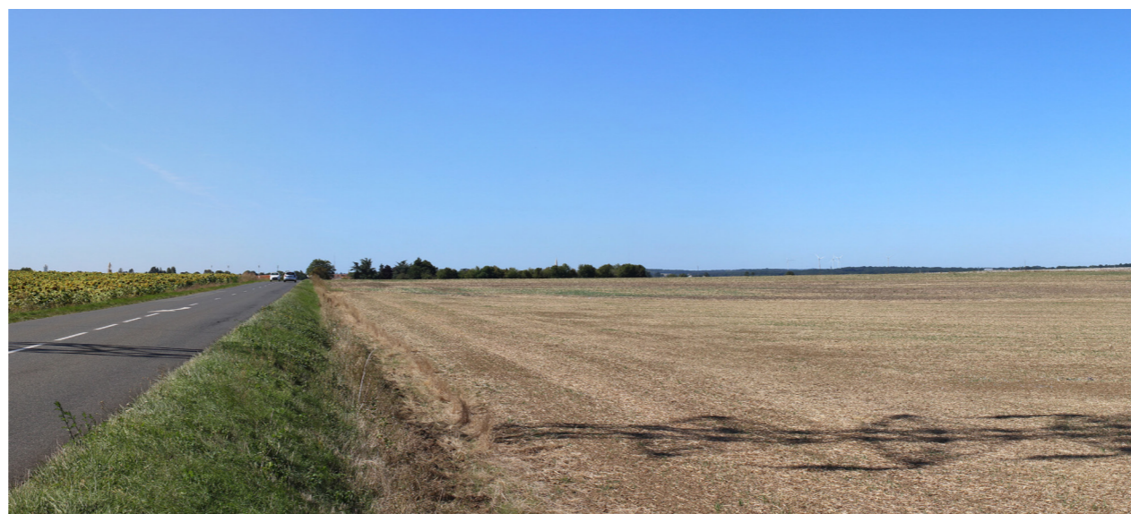
Photographie de l'état initial à 50°